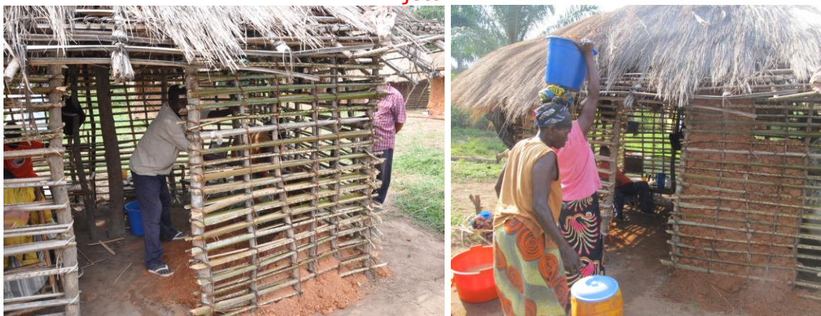
Stambene kuće - glavna hrana palenta i riža