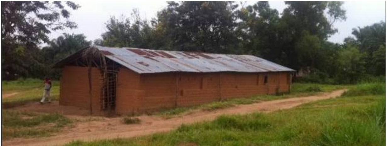
Gore: crkva izvana; Dolje misa - ples za vrijeme mise

Kad su me pitali da li bih išao opet nisam ni razmišljao, naravno opet bih išao, čim se ukaže prilika.