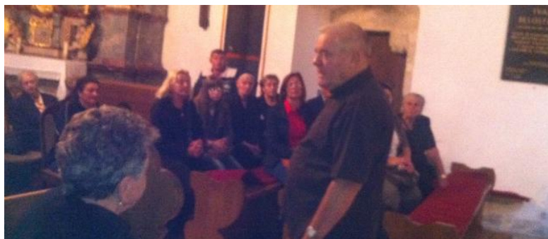
Župnik s hodočasnica.