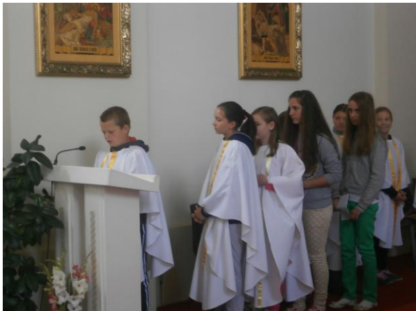
Učenici mole Molitvu vjernika