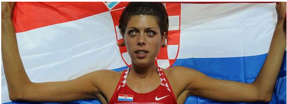
Lički Osik * Široka Kula