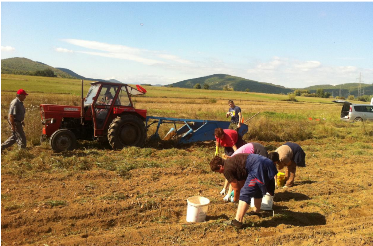
Akcija branja krumpira. Treću godinu za redom Caritas provodi akciju sadnje i ubiranja krumpira za portebe siromašnih, pučke kuhinje i drugih.