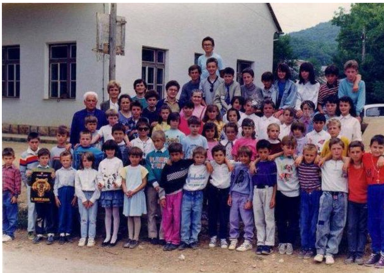
Mušaluk 1992. Godine. Djeca sa svojim učiteljima.

„Živimo u svijetu u kojem ljudi olako odbacuju svoje križeve“