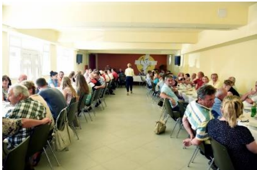
uveličali ovaj veliki jubilej.

Nakon svete mise pokraj crkve uslijedilo je druženje uz tamburaše i KUD koji su