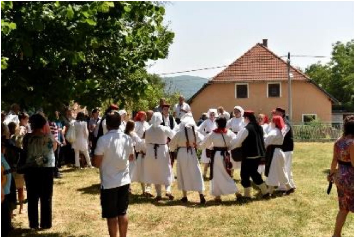
Lički Osik * Široka Kula