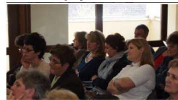
Sudjelovali su i predstavnici našeg župnog zbora.

morala najprije očitovati kao naše hvaljenje Boga, zatim kao zahvaljivanje i tek onda kao prošnja. U tom vjerničkom odnosu prema Stvoritelju eminentno mjesto ima liturgija. Ona je "uzlazno-silazna zahvala Bogu", a bogoslužje je "sastavni dio našega kršćanskog identiteta" i ono se obavlja uvijek u zajednici, jer Krist nas je pozvao u zajednicu da mi zajedno budemo s Njim, istaknuo je prof. Steiner.