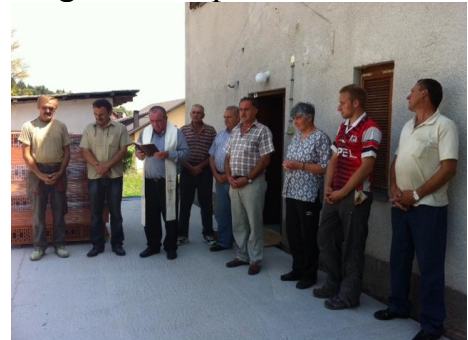
Blagoslov na početku radova