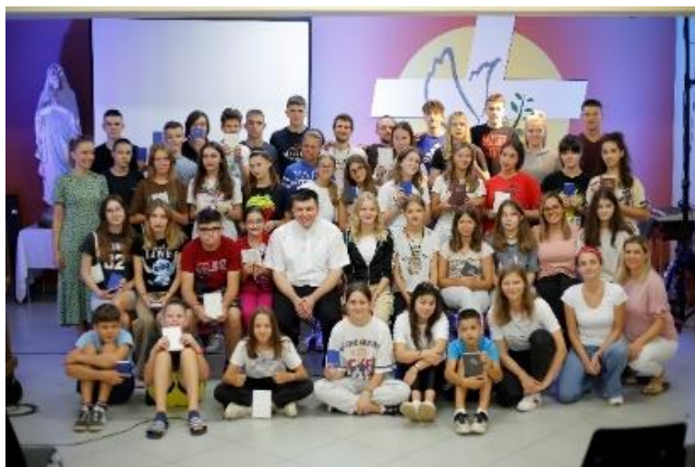
Lički Osik * Široka Kula